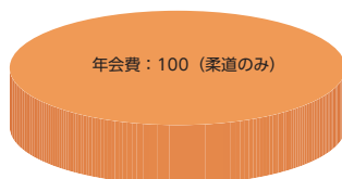
グラフ中の単位：千円