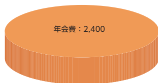
グラフ中の単位：千円