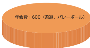
グラフ中の単位：千円